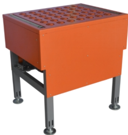
自动斜导轮分拣机